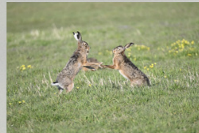
Boksende hazen