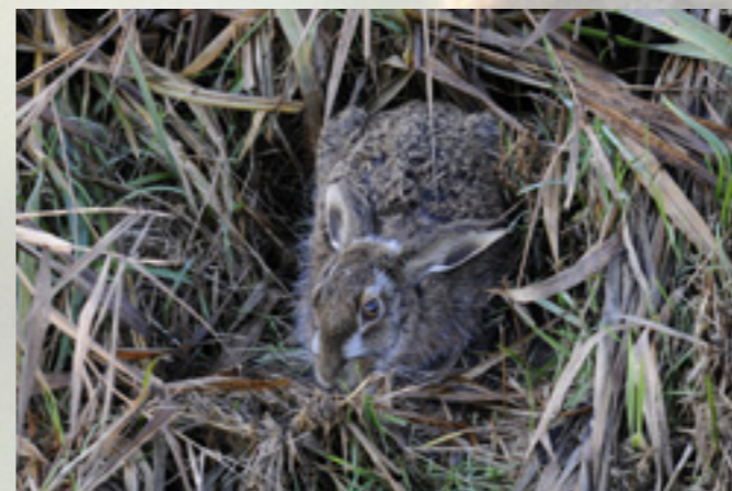
Haas in leger