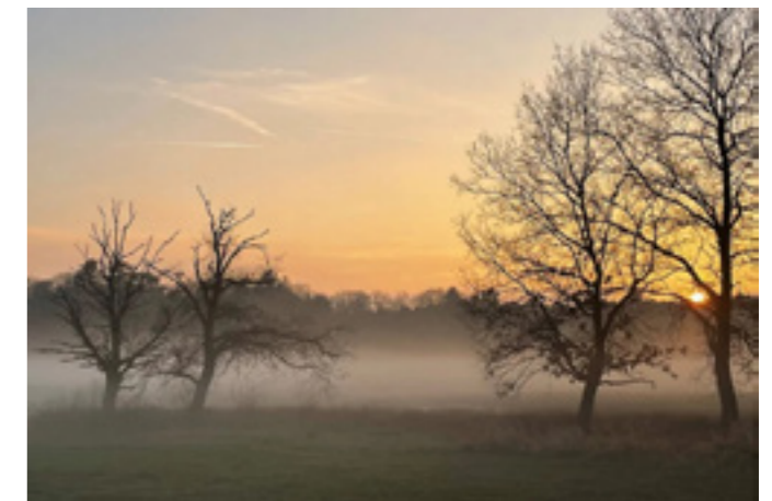
WA Hoeve in de ochtendnevel

De actie voor crowdfunding van 'Vrienden van de WA Hoeve' (voor onder meer juridische advisering) is succesvol geweest (5.000 euro). Verder is er aanzienlijke steun verkregen van de stichting Advocaat van de Aarde. Het Verweer van het college is binnen en een reactie van Beter Zeist wordt daarop voorbereid. In december werden de bezwaren op verzoek van de Raad van State nader toegelicht aan Stichting Advisering Bestuursrechtspraak.