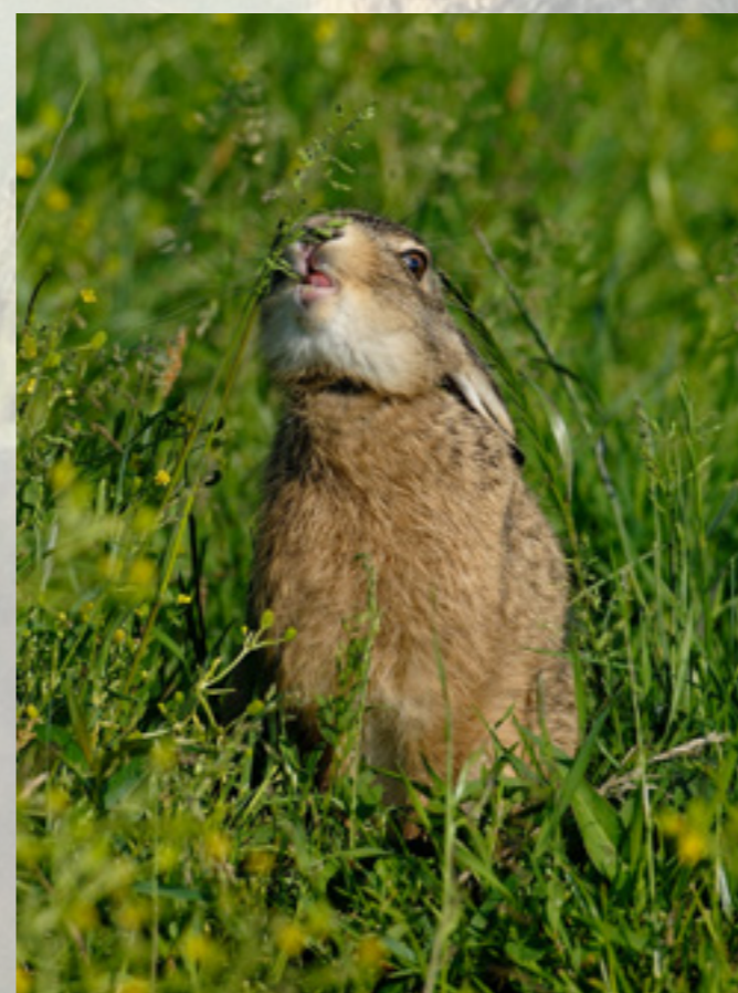
Grasetend jong