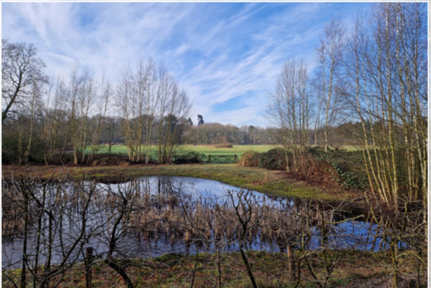
Landgoed Beerschoten, alvast een voorproefje op de voorjaarsactiviteit!

Biltseweg 8 | Bosch en Duin | schuitemanmacf.com