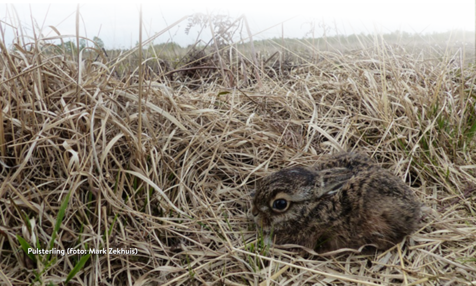
Pulsterling

rammelaars de achtervolging in het vizier krijgen doen ze maar wat graag mee. Hier begint het recht van de sterkste. Het is een heel spektakel, zo'n groep rennende, springende, over elkaar buitelende hazen. Alle atletische vaardigheden worden op de proef gesteld. Maar dat is nog niet alles. Staand op hun achterpoten wordt er ook flink gebokst waarbij rake klappen worden uitgedeeld. Rico Verhoeven verbleekt hierbij. Trappen, slaan, grommen, acrobatische lichtsprongen: het hoort er allemaal bij. Net zo lang tot de meeste uitgeput