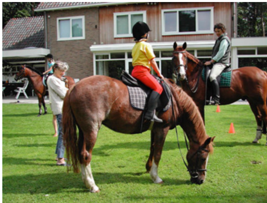
Trainen in de achtertuin rond jaar 2000

Ik moet wel zeggen dat er altijd veel onrust is geweest rond onze stallen. Er zou bijvoorbeeld een uitbreiding komen van het golfterrein. Dat ging niet door. Maar we raakten daardoor wel de achterste lange wei kwijt. Een paar jaar later werden er stukken bos aan bewoners verkocht. Toen dreigde het bos voor een groot deel omheind te worden. Mede door de inspanning van de Vrienden van De Biltse Duinen is het goed afgelopen en kunnen we er allemaal