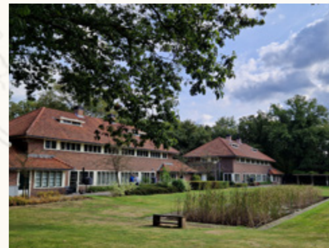
Zusterhuizen van architect Mertens

Ten zuiden van de Directielaan werden in 1928 twee vrouwenpaviljoens gebouwd, ten noorden ervan twee mannenpaviljoens. De scheiding mannen/vrouwen bleef met de bouw van deze vier paviljoens gehandhaafd. Tussen 1928 en 1931 werden, eveneens door Mertens, aansluitend zes dubbele zusterhuizen gebouwd aan weerszijden van de centrale as, vlak bij het directiegebouw. Dit complex de Vijverhof ontwierp Mertens in een U-vorm rond twee vijvers.