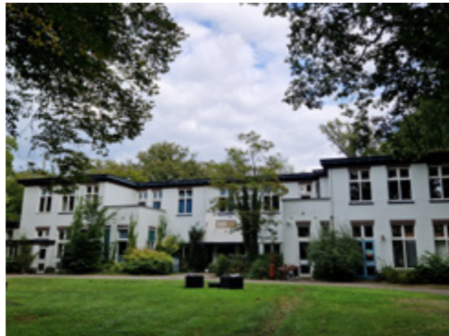
Paviljoen Spinoza van architect Poggenbeek

drie lanen ontwikkeld in noordelijke en zuidelijke richting, parallel gelegen en haaks op de middenas.