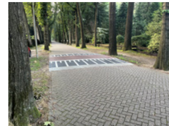
Nieuw aangebrachte drempel op de Duinweg

De aanleg van extra verkeersdrempels in Bosch en Duin is bijna volledig afgerond. De laatste drempels, zoals die op de kruising Duinweg-Dennenweg, worden binnen twee maanden nog wat steiler gemaakt om de snelheid verder te verlagen. De maatregelen die al zijn uitgevoerd, hebben de snelheid op de Taveernelaan en Tolhuislaan significant teruggebracht. Bewoners hebben positief gereageerd op de verandering. De drempels zijn effectief, maar veroorzaken geen overmatige geluidsoverlast.