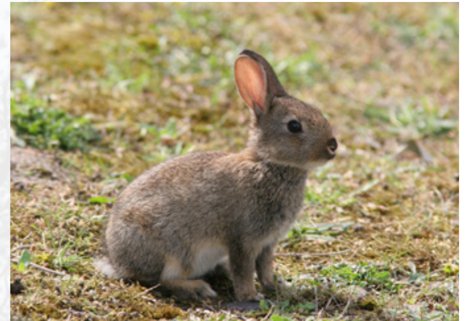
Een jong konijn is niet veilig voor bosuil

De bosuil lijkt zwaarder dan hij in werkelijkheid is. Onder het dikke verenkleed zit een kleine vogel met een lange nek. Zachte donsveertjes voor bescherming tegen kou gaan schuil onder gladde, waterbestendige veren.