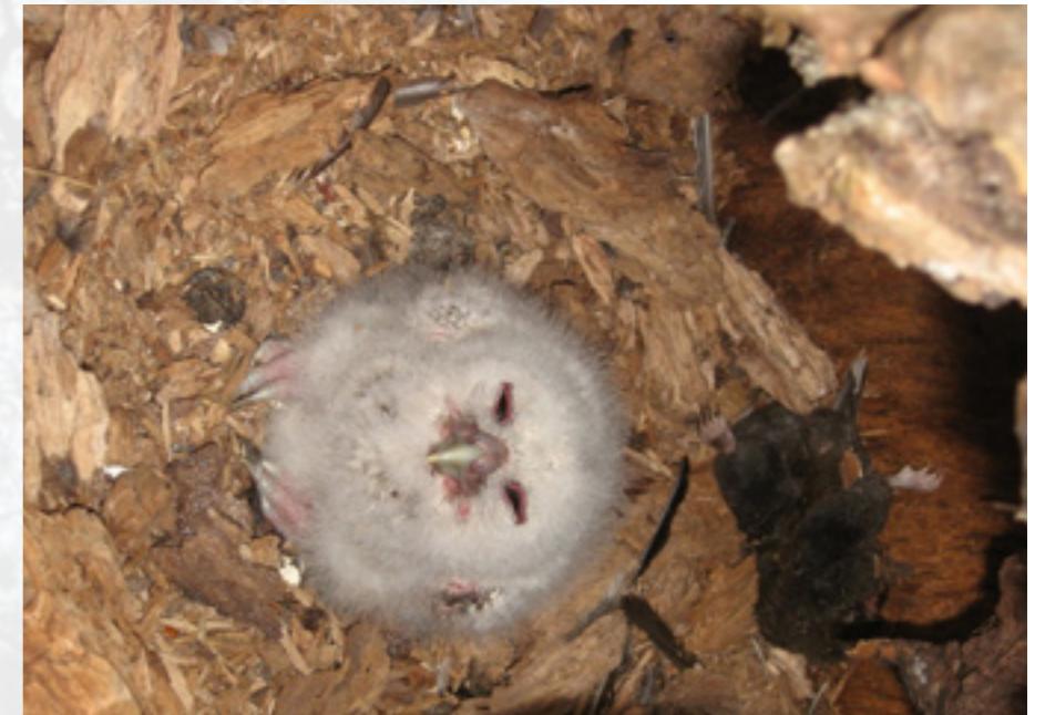
Pul met twee mollen in de voedselvoorraad