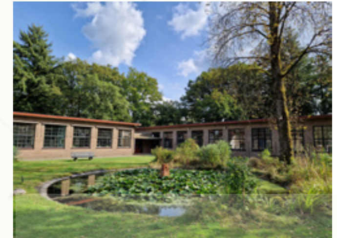
Carré van architect Mertens