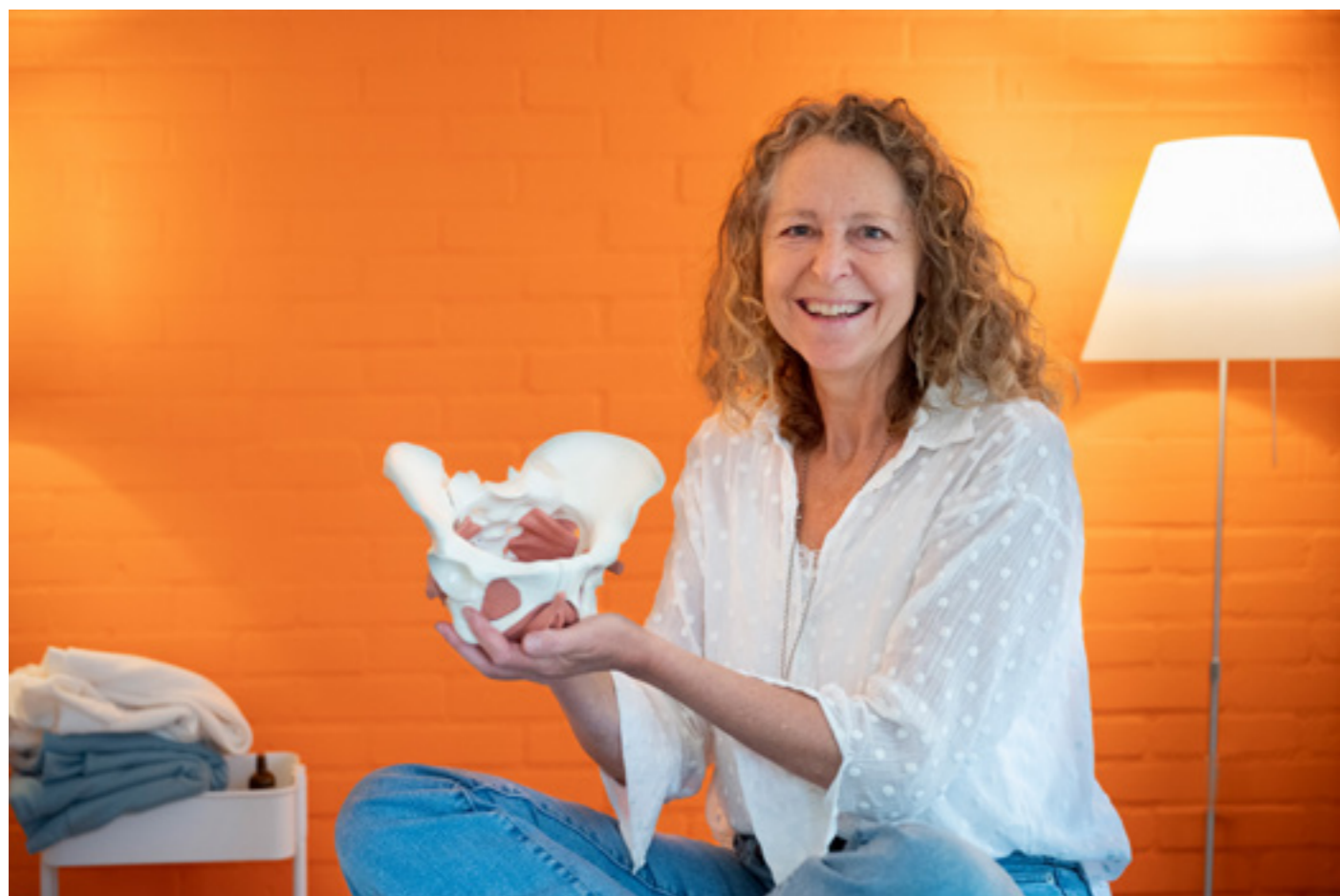
Regina met model voor uitleg over vrouwenlichaam

Bacchuspreis in ontvangst nemen als blijk van waardering. Van de Koninklijke Vereniging van Nederlandse Wijnhandelaars kreeg ik in 2018 de wijnpenning voor de grote betrok-