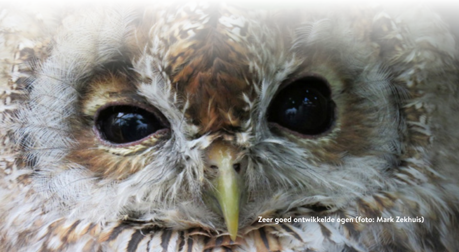
Zeer goed ontwikkelde ogen

In ons land is de bosuil de meest voorkomende uil en de stand is met circa vijfduizend broedparen de laatste jaren vrij stabiel. Wat hierbij zeker helpt, is het ophangen van een uilenkast mits u in een boom-/bosrijke omgeving woont. Het doet me deugd dat het met onze grootste uil, de oehoe, stapsgewijs wat beter gaat. Met andere uilensoorten gaat het helaas minder goed. Zo gaan steenuil en kerkuil, liefhebbers van kleinschalig boerenland, al jaren in aantallen achteruit. En, hoewel nog redelijk algemeen, geldt dat ook voor de ransuil, vooral in landbouwgebieden. Helaas is de velduil uiterst zeldzaam geworden door verlies aan vochtige leefmilieus.