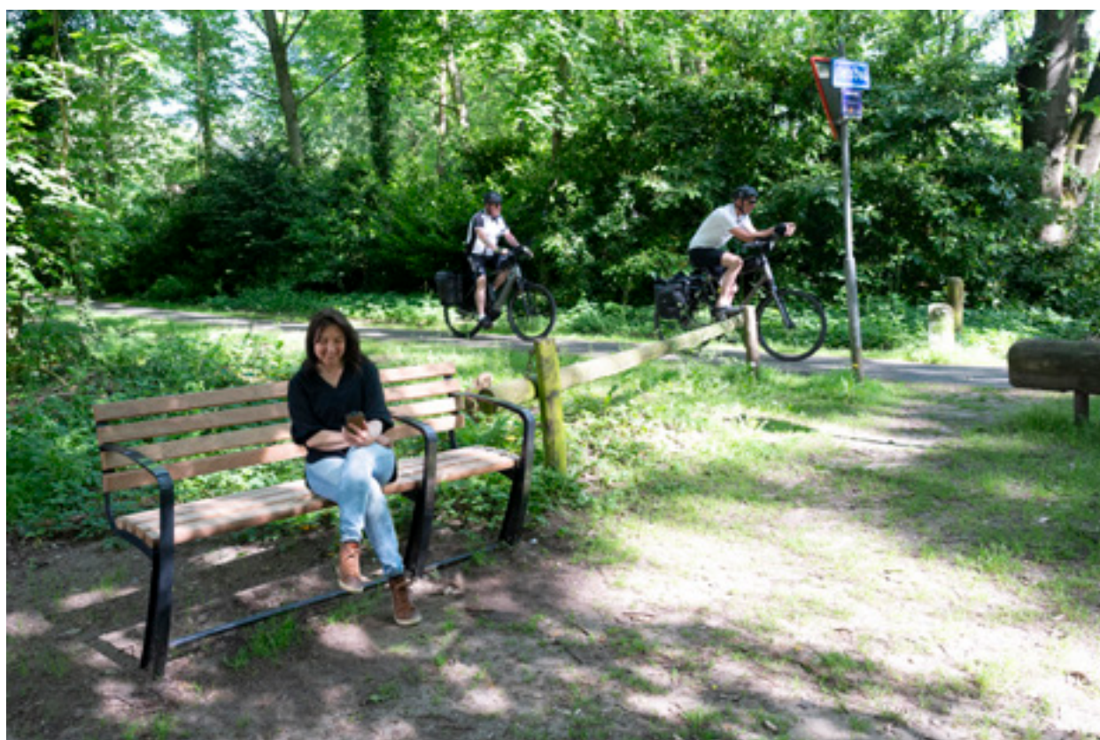
Fietspad Oude Spoorbaan met nieuw bankje

Vanwege klachten over te hoge snelheden plaatst de gemeente in de periode eind juni tot eind juli extra verkeersdrempels op de Duinweg, de Tolhuislaan, de Taveernelaan en de Baarnseweg. De uitvoering is qua steilheid vergelijkbaar met de drempel bij de 'plateaus', die komen op de 11 kruispunten.