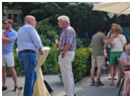
Vrijdagmiddagborrel Bosch & Duin

Omdat december voor velen van ons al een drukke maand is kozen wij ervoor de laatste vrijmibo van het jaar een maand eerder te houden.