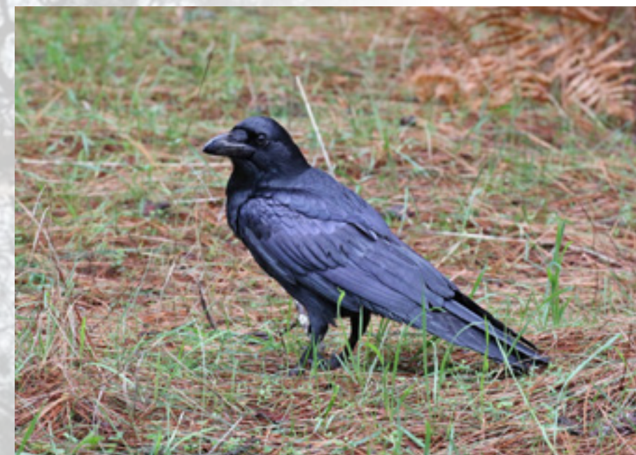
Imposante zangvogel met roofvogeltrekjes