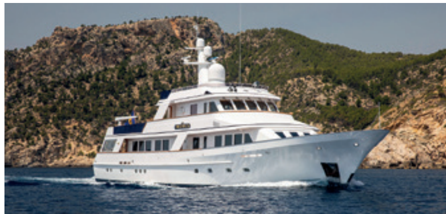
MONACO | Feadship | 38m. | 4 cabins - 8 guests For sale asking price € 5.600.000,-