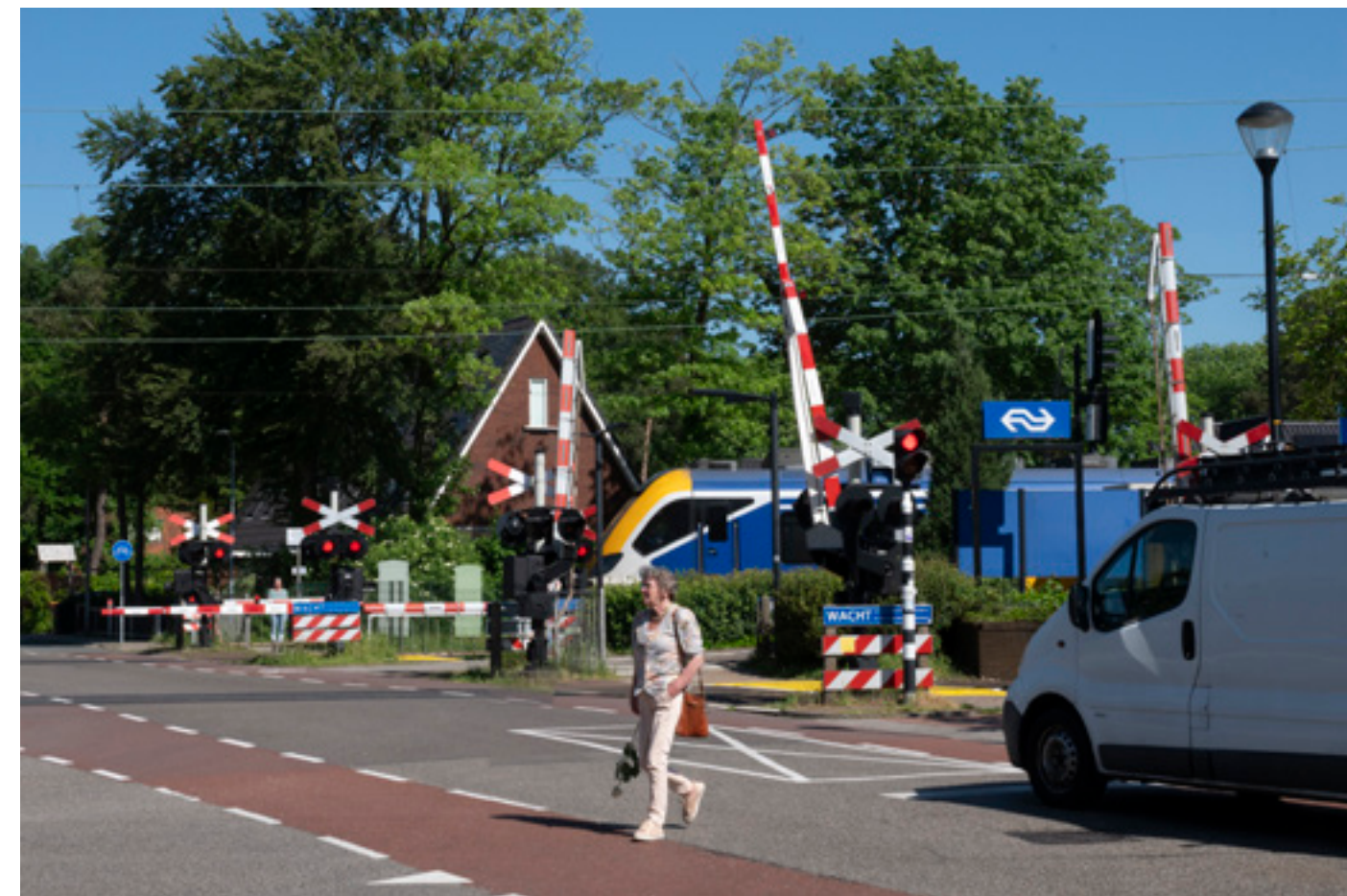
Spoorwegovergang in Den Dolder

De spoorwegovergang in Den Dolder wordt in de toekomst afgesloten voor gemotoriseerd verkeer. De overgang blijft wel open voor fietsers en voetgangers. Er zijn geen nieuwe ontwikkelingen voor ruimtelijke ordeningszaken.