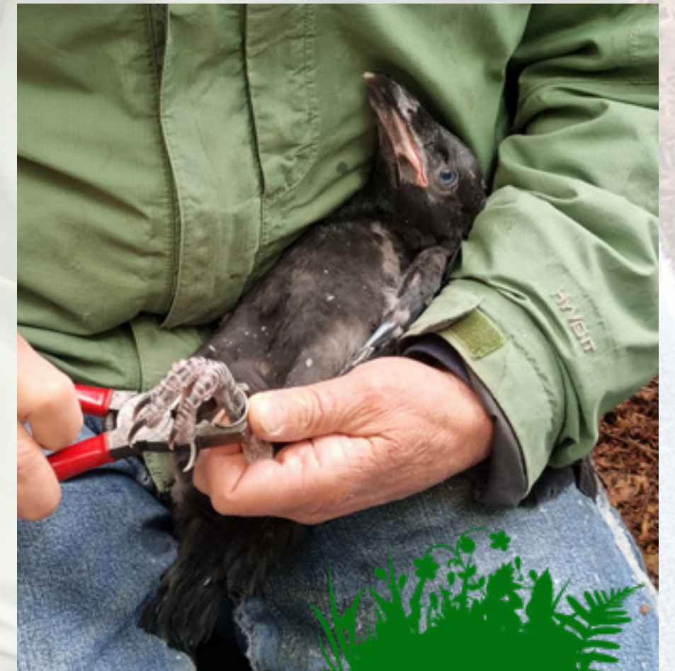
Aanbrengen van ring voor onderzoek

Sinds 2013 voorziet de werkgroep de pullen van een kleurring met nummer en neemt biometrie af. Dit maakt het gemakkelijker om de vogels te monitoren en overlevingsanalyses te maken: hoe verspreiden ze zich, hoe oud worden ze? Maar ook voor onderzoek naar het effect van bijvoorbeeld vogelgriep is het van belang dat de vogels gemonitord blijven.