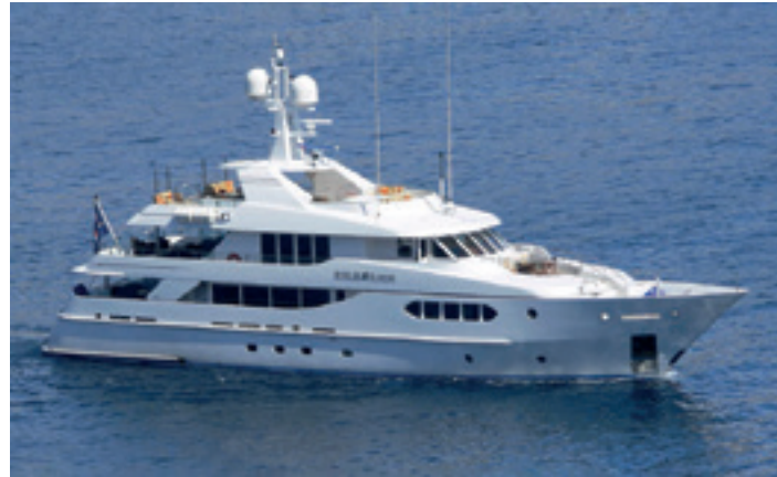
PERLE BLEUE | Hakvoort | 38m. | 4 cabins - 12 guests Weekly charter rate € 112.000,- ex APA