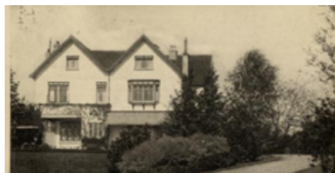
Villa Santhoeck 1910