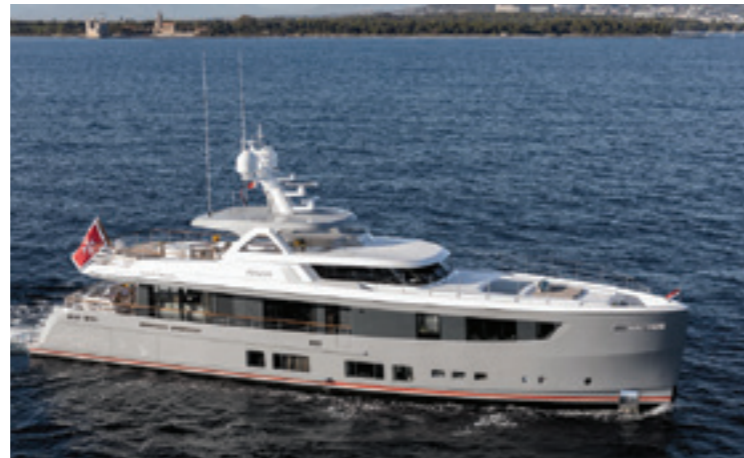
MANA I | Hakvoort | 36m. | 5 cabins - 10 guests Weekly charter rate € 135.000,- ex APA