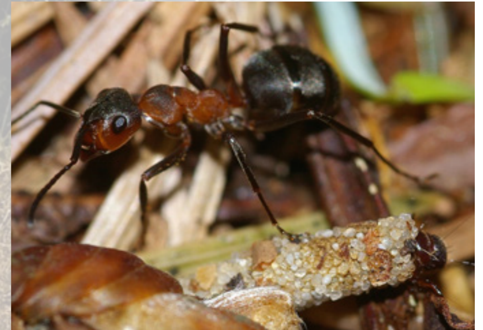
Behaarde bosmier

In het Panbos leven voornamelijk kale en behaarde bosmieren. De kale bosmieren, hebben nauwelijks haren op het voorste borststuk. Behaarde mieren hebben minimaal 26 haren. Het determineren is lastig. Niet alleen omdat er ook hybride soorten zijn, maar ook omdat ze venijnig kunnen bijten, waarbij mierenzuur wordt afgescheiden. In het nest van de kale mier leven vaak meerdere