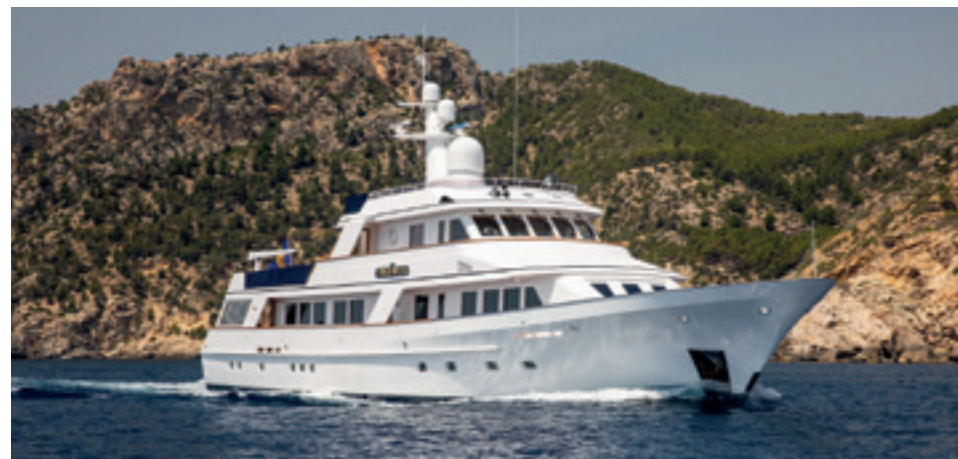
MONACO | Feadship | 38m. | 4 cabins - 8 guests For sale asking price € 5.600.000,-