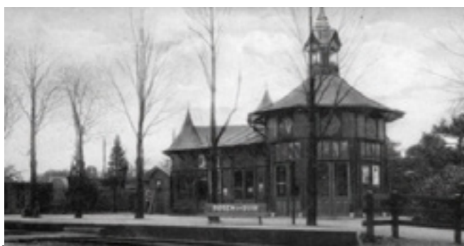
Station Bosch en Duin, 1907-1941

Begin 1900 werden er verschillende 'lokaalsporen' aangelegd om het Utrechtse platteland te ontsluiten. De Nederlandse Centraal Spoorwegmaatschappij (NCS) die al de spoorlijn Utrecht-Zwolle exploiteerde, legde rond 1900 aan de oostkant van Utrecht een tweetal 'lokaalspoorlijnen' aan: de spoorlijn Den Dolder-Baarn en de spoorlijn Bilthoven-Zeist. Beide lokaalreinen reden over het hoofdspoor van de NCS door naar het hoofdstation van Utrecht. De lijn Bilthoven-Zeist was 7 kilometer lang en liep door een woest gebied met heide, stuifzand en bossen. De lijn was aanvankelijk enkelsporig maar werd in 1912 verdubbeld. Door de nieuwe verbinding kon je vanuit Zeist in 23 minuten naar Utrecht reizen. Dit was een enorme verbetering voor de inwoners van Zeist, Huis ter Heide en later ook Bosch en Duin