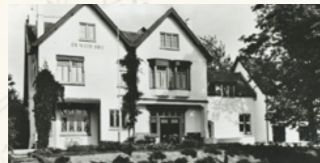
Gezicht op De Witte Hei (1955)

Het pand is later aan de rechter zijde verder uitgebreid door architect B.W. Plooy uit Amersfoort. De naam Santhoeck is gewijzigd in De Witte Hei. In 1948 werd het huis geopend als conferentieoord en werd het een gereformeerd jeugdcentrum.