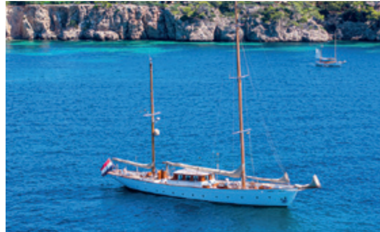
IDUNA | Feadship | 33m. | 3 cabins - 6 guests Weekly charter rate € 39.000,- ex APA | also available for sale