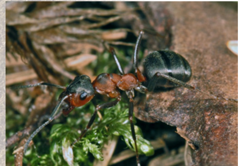
Kale bosmier