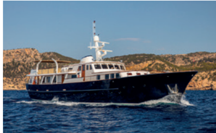
SANTA MARIA | Feadship | 33m. | 3 cabins - 6 guests Weekly charter rate € 49.000,- ex APA | also available for sale