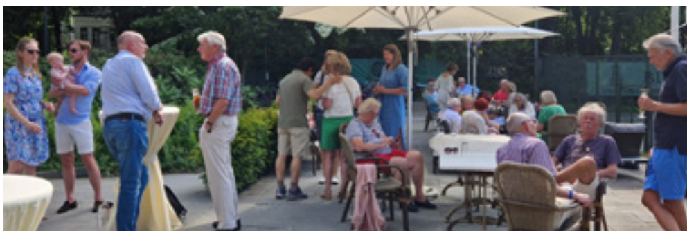
Vrijdagmiddagborrel Bosch & Duin

Nog niet alle onderwerpen zijn bekend. Houd de nieuwsbrieven en de website hiervoor in de gaten. Op 20 maart denken we aan de volgende onderwerpen: Jacht & jagers; duurzaamheid; watermanagement; ontwikkelingen rond de voormalige vliegbasis in het hart van de Utrechtse Heuvelrug.