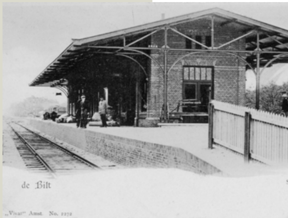
Het NCS station De Bilt, rond 1900 (no. 8494)

waren en jong. Het landschap had daardoor een open, her en der zelfs woestijnachtig karakter. Zeist voerde als argumenten aan: bevordering vreemdelingenverkeer, verbetering goederenverkeer, de goede en nuttige ligging van het geplande station Zeist aan de kant