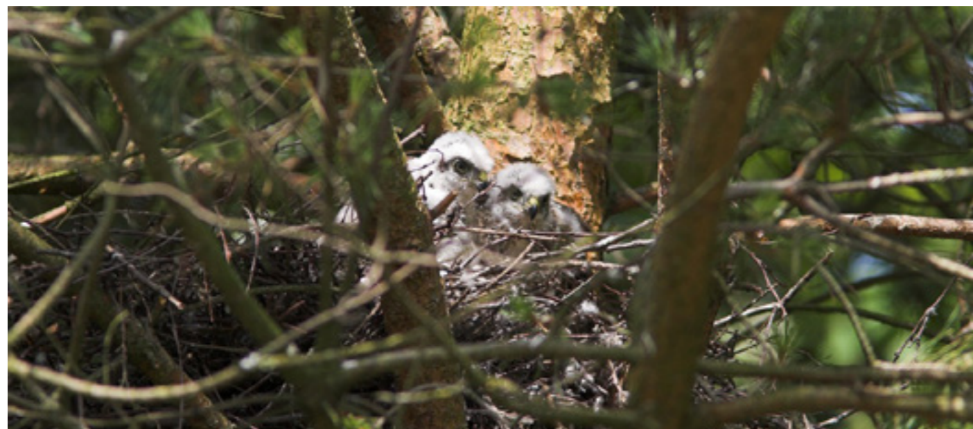
Sperwerjongen op nest

van mogelijke roofvogelbroedparen in de beschermde natuurgebieden binnen de regio Bosch en Duin zijn niet bekend, omdat daar geen monitoring plaatsvindt. Zowel Utrechts Landschap als de Werkgroep Roofvogels zouden toch graag willen weten waar de roofvogels, met name de sperwer, dit jaar een nest hebben (gehad). Mocht u van een nest bij u in de buurt of in de tuin weten, dan ontvang ik graag uw bericht op noord@utrechtslandschap.nl .