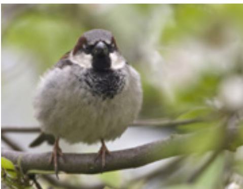
Huismus (Luc Hoogenstein)

In 1958 opgericht, telt de Vogelwacht Utrecht inmiddels zo'n 850 leden die zich bezig houden met vogelstudie, vogelbescherming, educatie en excursies. Het werkterrein is de hele provincie Utrecht, onderverdeeld in zes 'geografische' afdelingen.