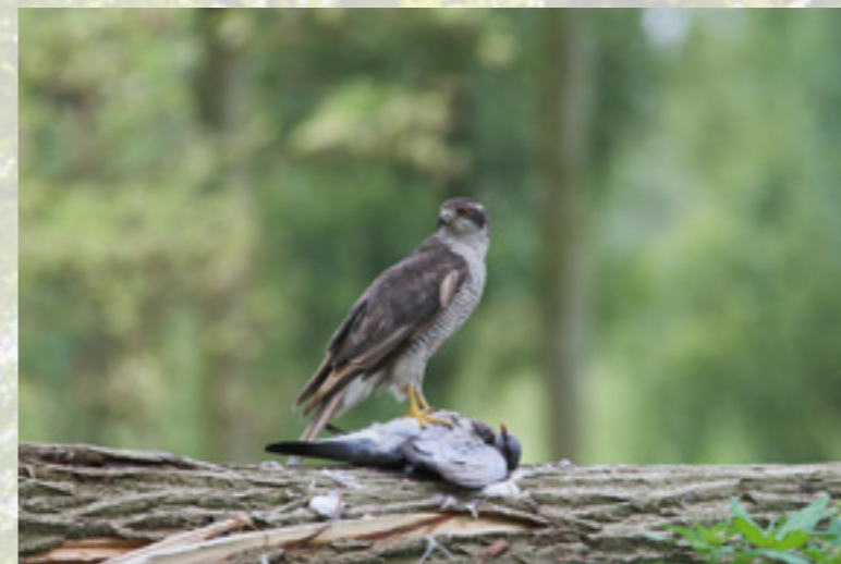
Havik met prooi (Martin Mollet)