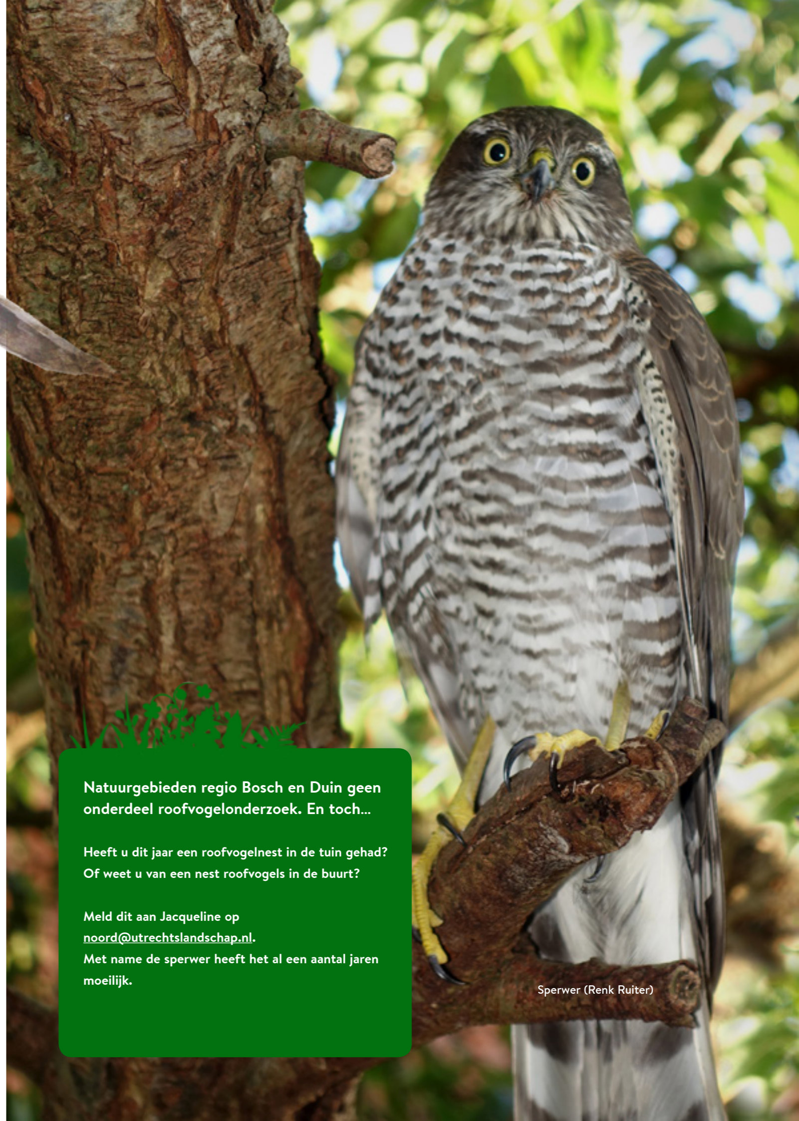
Sperwer (Renk Ruiter)