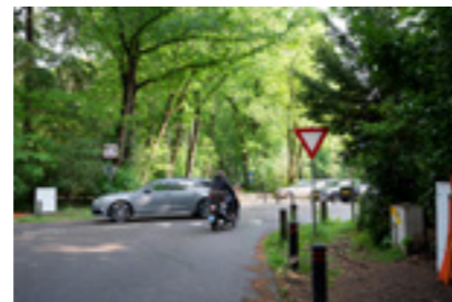
Huidig kruispunt Vossen-, Taveerne-, Hobbemalaan