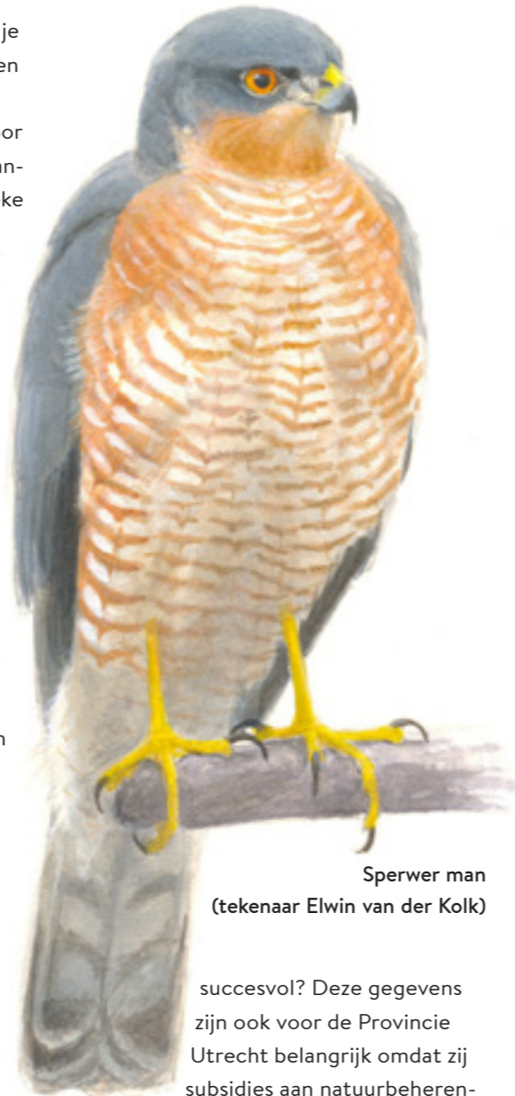
Sperwer man (tekenaar Elwin van der Kolk)

En dan is het zover. De herinrichtingswerkzaamheden of terugkerende beheermaatregelen zijn uitgevoerd en dan is het afwachten. Hier zijn vaak vele jaren mee gemoeid, voor omwonenden en bezoekers niet altijd even fijn. Zijn de natuurontwikkelingen volgens verwachting? Meerjarig onderzoek is hiervoor belangrijk. Zo wordt nu bijvoorbeeld in Park Vliegbasis Soesterberg door de Provincie Utrecht onderzoek gedaan naar de broedpopulatie veldleeuweriken in het terrein. Zijn ze nog steeds zo