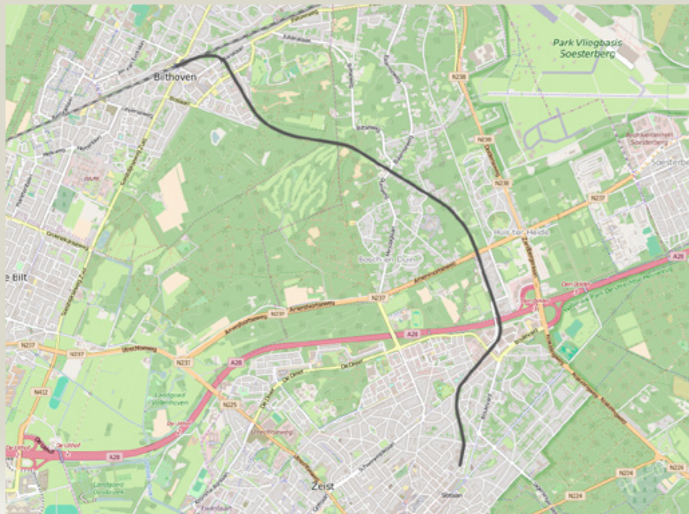
Spoorlijn De Bilt – Zeist ( https://commons.wikimedia.org/w/index.php?curid=9990755 )

De halte van de jonkheer Zeist was lang slecht bereikbaar. Langs de spoorlijn Utrecht – Arnhem werd in 1845 voor Zeist een station aangelegd in de gemeente Driebergen. Niet echt dichtbij dus. En in 1863 werd de spoorlijn Utrecht – Kampen via Amersfoort en Zwolle aangelegd, de zogenaamde Centraal-spoorweg. Het dorp De Bilt had in die tijd slechts circa 1.800 inwoners