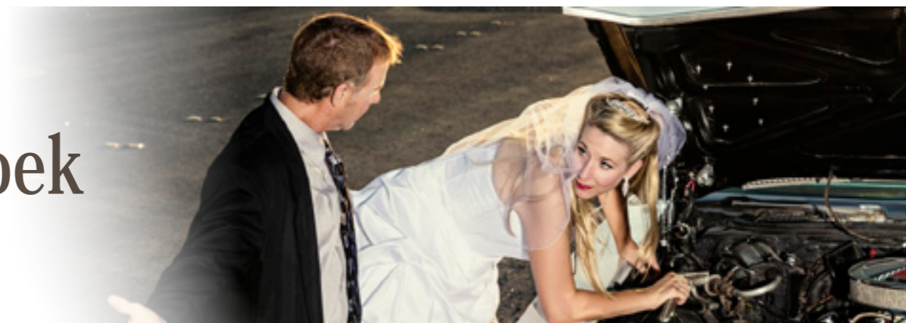
Divorce of Figaro