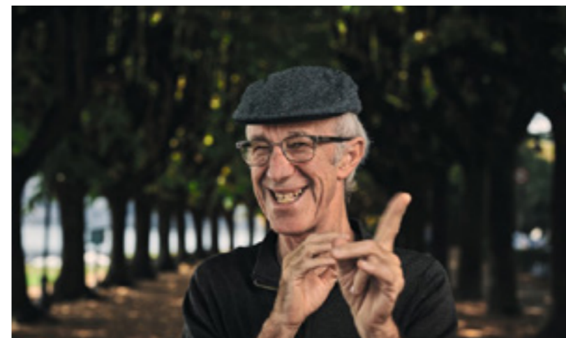
Raymond van Groenewoud

Met zijn opgewekte popsongs is de Amerikaanse singer-songwriter een graag geziene gast in Nederland en Europa.