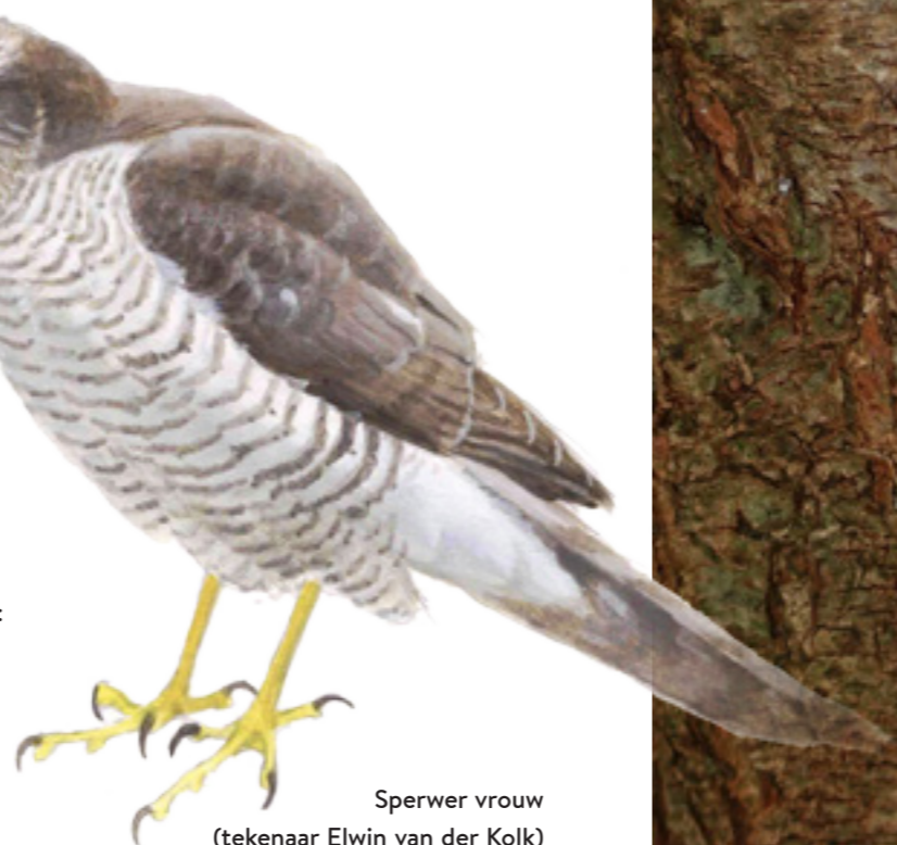
Sperwer vrouw (tekenaar Elwin van der Kolk)

Sinds jaren vindt roofvogelonderzoek plaats in onder andere de Willem Arntsz Hoeve, het Ridderoordse bos en Beukenburg/De Leyen. Gegevens