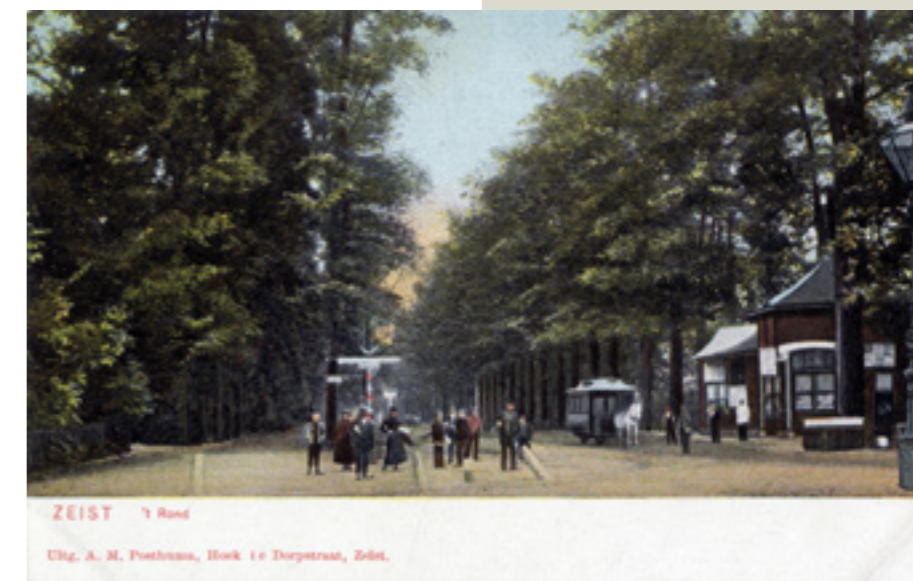
't Rond in Zeist, rechts de paardentram Zeist – Driebergen