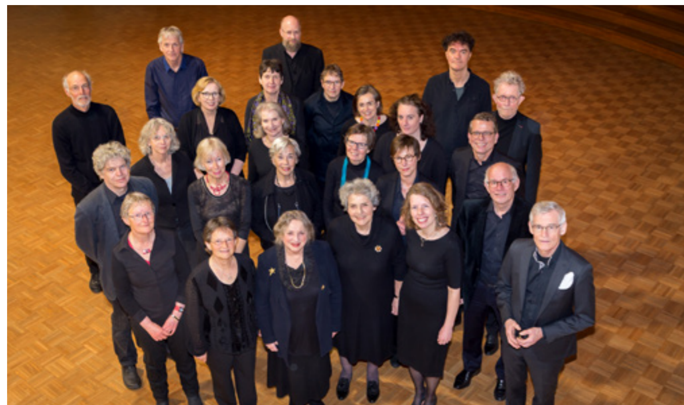
Het Oudemuziekkor Bosch en Duin

Dankzij de grote variatie aan Zeister monumenten is het ook dit jaar weer gelukt om een afwisselend programma samen te stellen voor de 36e editie van de open monumentendagen. Het thema voor 2022 is 'Duurzaamheid'. Waar mogelijk sluit Zeist aan bij het landelijke thema. Extra leuk dit jaar is de samenwerking met Stichting CultuurZeist die op allerlei manieren zal zorgen voor passende activiteiten in of bij de monumenten. Vanzelfsprekend nemen heel veel gemeenten deel aan de open monumentendagen.