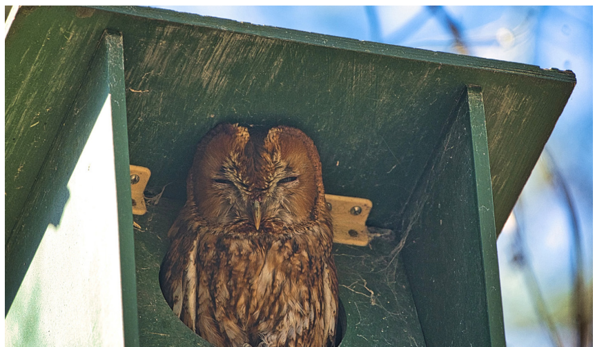
Eén van de ouders

Vroeg de volgende dag kwam Leida langs, gewapend met een weegschaal. Om te bepalen of het goed ging en het jonkie gevoerd werd door de ouders, was het plan het uiltje voorzichtig uit het nest te halen en te wegen. Dat bleek niet nodig. Toen Leida het klepvak opende, vloog moederuil uit de nestkast en lag er een verse prooi naast het