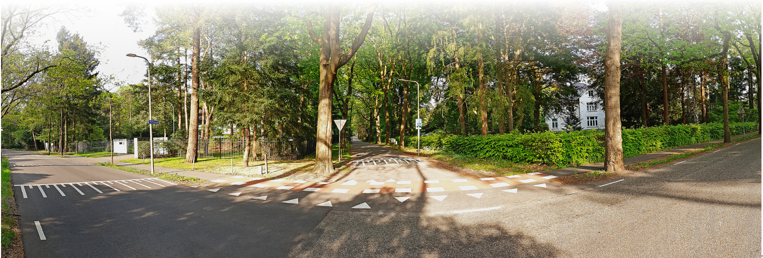
De lente bloeit door

Heel los naar een idee van Irene Vella, die een ontroerende tekst schreef over Italië ten tijde van het Coronavirus: era l'11 marzo del 2020