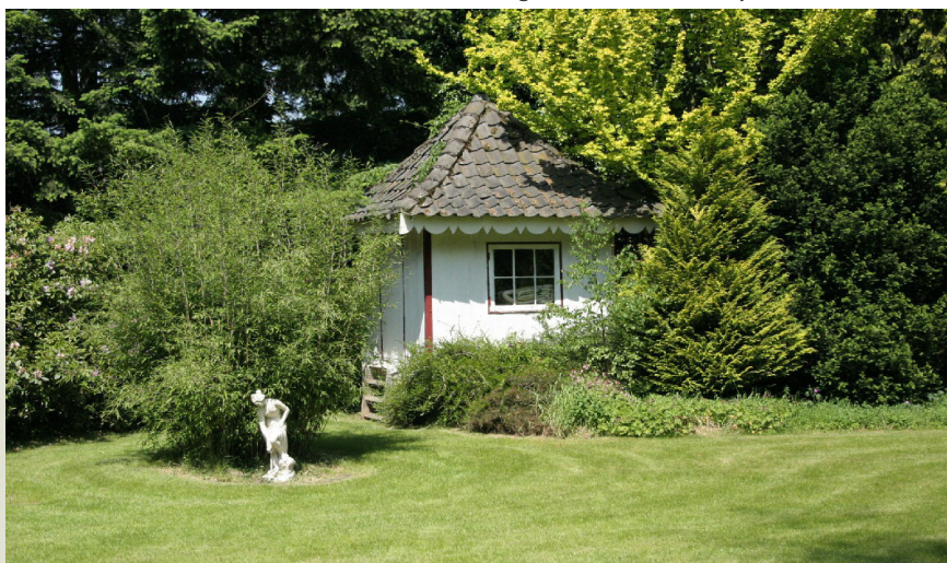
De Chinese tent

Voorts vermeldt de notariële acte dat er wel een paardenstal met koetsiers- en tuinmanswoning gebouwd mocht worden maar geen "arbeiderswoningen, geneeskundige inrichtingen, kloosters, fabrieken, bordelen en danshuizen, bierhuizen, herbergen en logementen (zijnde niet van den eersten rang)". Er wordt zelfs in het koopcontract aangegeven hoe er omgegaan moet worden met de "faecale stoffen der paarden"! Aangezien ik allergisch ben voor paarden zal dit niet snel gebeuren maar de bepaling van dat bierhuis is toch jammer. Stiekem drinken we gewoon ons wijntje op het terras en toosten op de rijke geschiedenis en de heerlijke woonomgeving van Bosch en Duin.