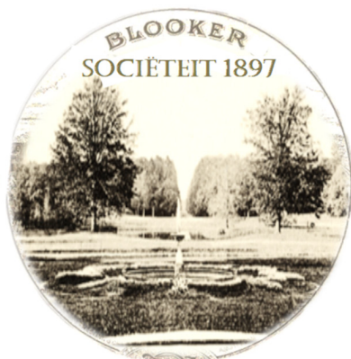
Nieuwe (!) logo Blooker