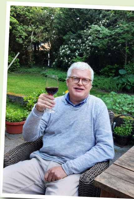
... en aankomend voorzitter