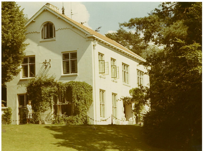
9. Duinhove omstreeks 1970