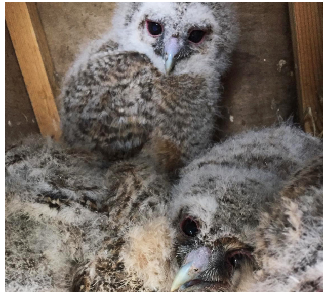
De vier uilsuikens

benieuwd wanneer ze zouden uitvliegen. Nu ja, "uitvliegen" is voor bosuilen niet het goede woord. Wanneer de kuikens een maand oud zijn, sporen de ouders hun jongen aan om uit het nest te fladderen. Dan belanden ze op de grond en klauteren vervolgens langs een boomstam omhoog naar een veilige tak. Vandaar dat ze op dat moment takkelingen genoemd worden.