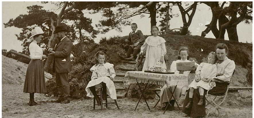
4. Het gezin in 1914 in zijn duinlandschap