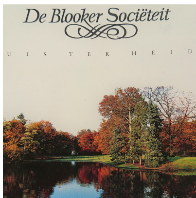
Oude (!) logo Blooker

Maar de oorspronkelijke opzet van de sociëteit, het onder vrienden periodiek bij elkaar komen voor een drankje en een hapje, een goed gesprek en uitwisseling van het buurtnieuws leeft nog als nooit tevoren. Dit initiatief leidde tot regelmatige huisbijeenkomsten. De leden treffen elkaar, met een roulerend gastheerschap, zeven keer per jaar. In de afgelopen 31 jaar bleef het niet alleen bij een glaasje wijn. De soosactiviteiten breidden zich uit tot het organiseren van lezingen, het organiseren van een jaarlijks (cultureel) uitje, een jaarlijkse barbecue en één keer per jaar een running dinner. Zo groeide een hechte vriendenkring met tegenwoordig 31 leden. De vriendschap heeft het vertrek van een aantal leden uit het woongebied overleefd. Ook zij zijn nog steeds van de partij. En het kriebelt nog steeds om toch weer parkdagen te organiseren om het zwerfvuil uit het park te halen. Het behoud van dit unieke historische groen binnen de stadsgrenzen is en blijft de drijfveer binnen de spirit van onze sociëteit.