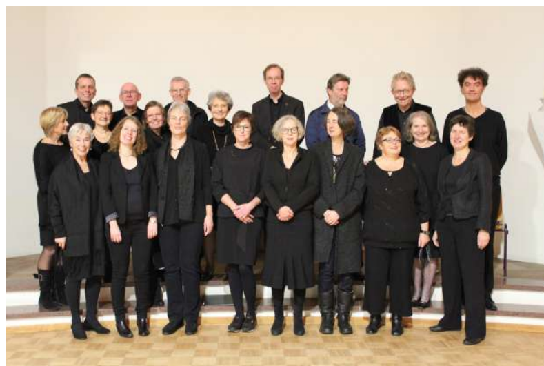
Oudemuziekkoor Bosch en Duin

Tekst maximaal 150 woorden, de redactie behoudt het recht inzendingen zonnig in te korten. Afbeeldingen in zo hoog mogelijke resolutie, een te lage resolutie kan niet worden afgedrukt. Publicatie op volgorde van binnenkomst. Inzendingen die met Bosch en Duin e.o. te maken hebben krijgen voorrang. Bij teveel inzendingen kan publicatie naar een volgende uitgave worden doorgeschoven. Inzendingen dienen aan de gangbare fatsoensnormen te voldoen en geen feitelijke onjuistheden bevatten. De redactie behoudt het recht inzendingen te weigeren voor publicatie. Vermeld duidelijk uw naam onder welke uw inzending gepubliceerd wordt. Inzendingen vertegenwoordigen niet de mening of smaak van de redactie