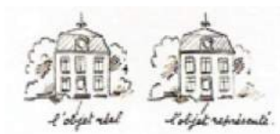
Villa Reelaan 12

was er in het MOMA [the Museum Of Modern Art] een overzichtstentoonstelling met het werk van René Magritte [1898-1967] te zien onder de titel 'The mystery of the Ordinary 1926-1938' (1). Magritte was een Bel-