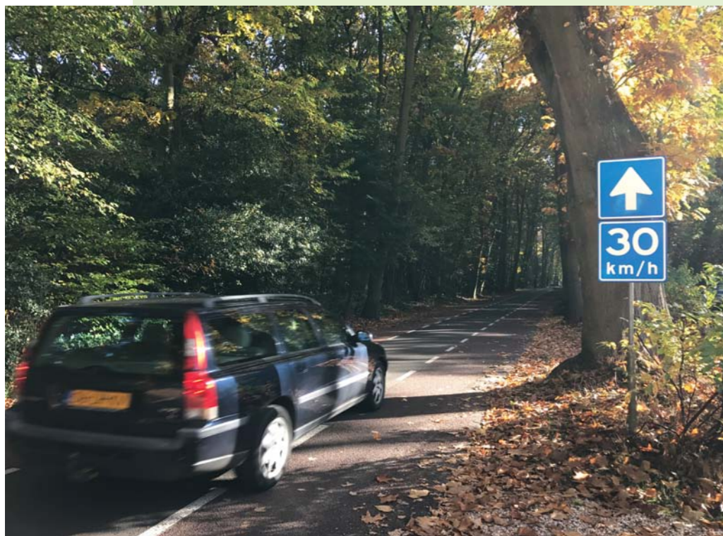
Weliswaar slechts 30 km/u maar tenminste nog open.

sloten, zoals bij de Hobbemalaan is voorgesteld, betekent dat het verkeer zich elders door Bosch en Duin verspreidt. Meer verkeer over vaak al te zwaar belaste wegen die langs andere woningen lopen zoals de Vossenlaan, Dennenweg, Baarnseweg, Duinweg en Mesdaglaan. Maar ook in Huis ter Heide zal bij sluiting van de Hobbemalaan een verhoogde verkeersintensiteit worden waargenomen. Denk aan de Ruysdaellaan en de Dolderseweg. Dat is ons inziens een ongewenste situatie.