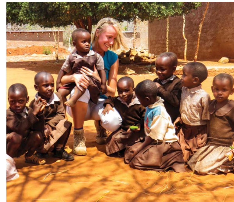
De plaatselijke school wordt betrokken bij het duurzamer benutten van de grond.

van palmolieplantages. Wij mensen claimen steeds meer land om te ontwikkelen. Maar ook op kleine en andere schaal gebeurt het, vaak uit onwetendheid. Vanmorgen was hier een man in de winkel die een schildpad wilde kopen voor in zijn vijver. Een