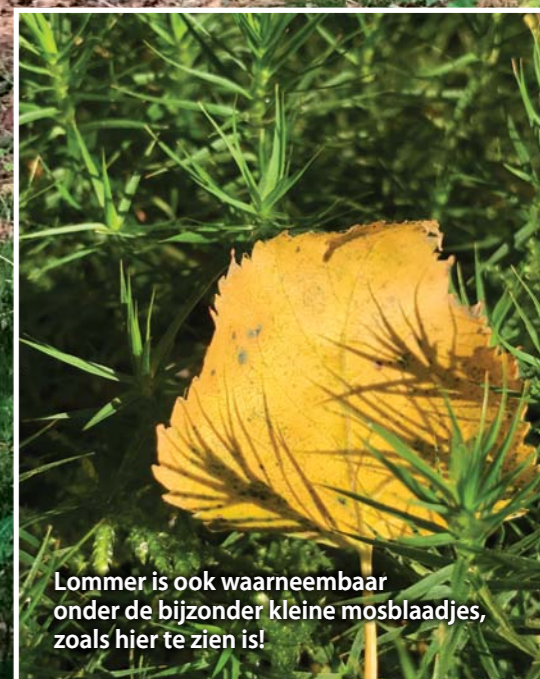
Lommer is ook waarneembaar onder de bijzonder kleine mosblaadjes, zoals hier te zien is!

In bosrijke omgevingen vinden we veel het fraai haarmos, dat in pollen of uitgestrekt zoden groeit. Het is een topkapselmos.