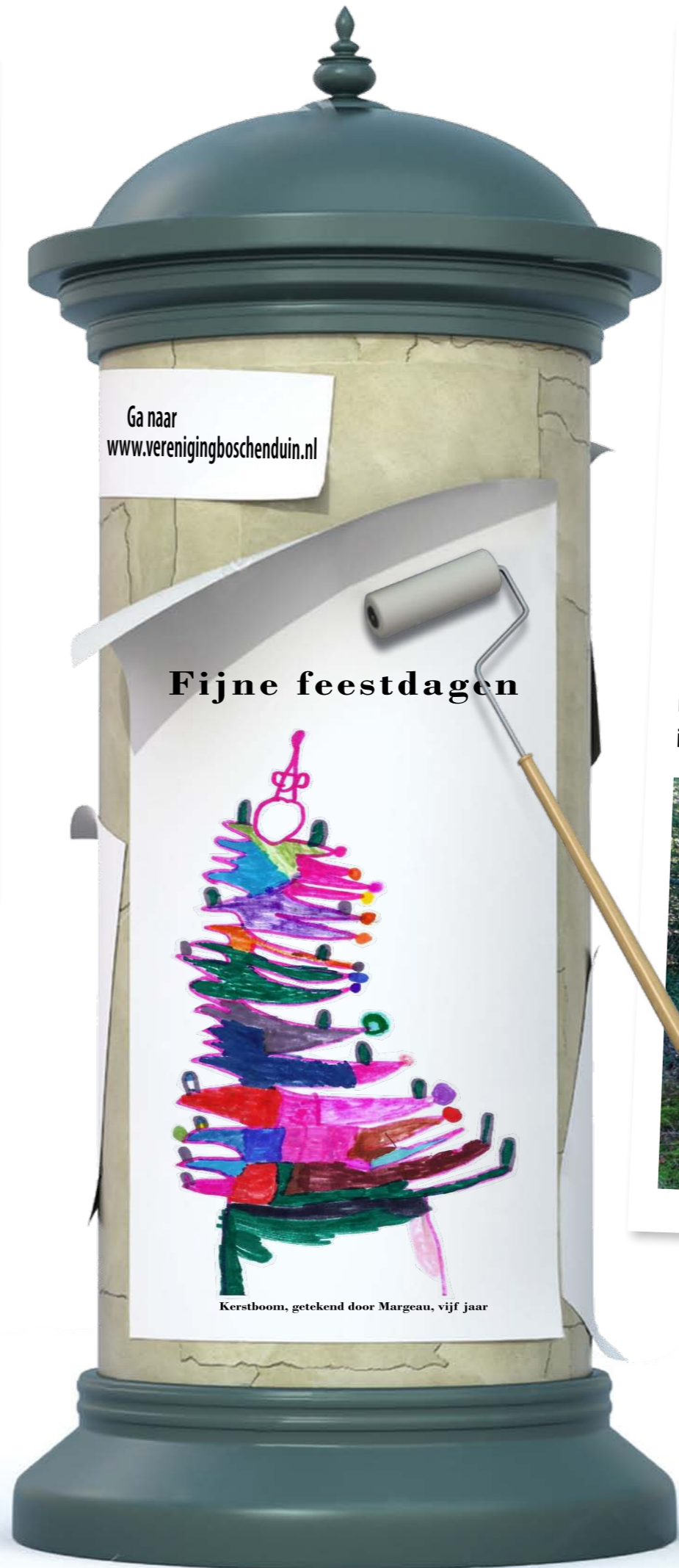
Kerstboom, getekend door Margeau, vijf jaar