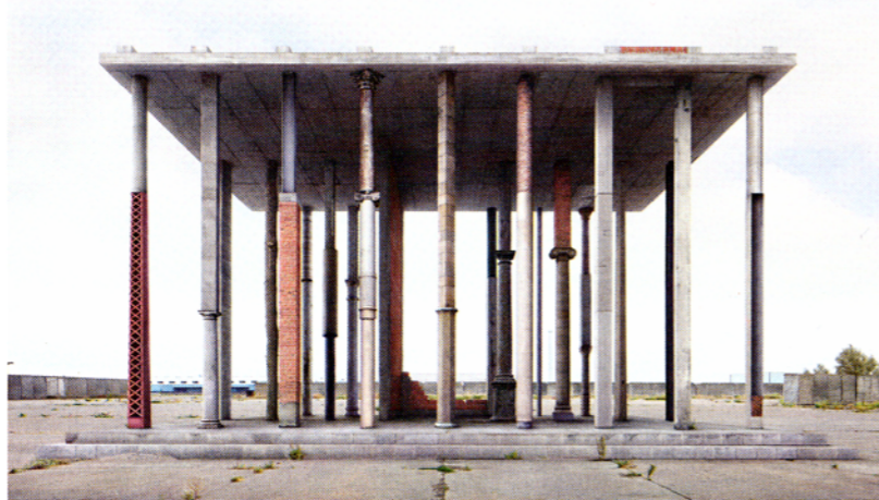
'Memorial I'; de Griekse tempel naar de hand van Filip Dujardin voor het Belgische paviljoen van de 15de architectuur Biënnale, Venetie 2016. De zuilen van deze fotomontage kunnen gezien worden als een palet van verschillende materialen die zijn gevonden op verlate plaatsen in het Belgische landschap.

De Nederlandsche Bank (DNB) verplaatst de goudvoorraad van de kluis in Amsterdam naar een nieuw te bouwen Cash Centre op het terrein van Camp New Amsterdam in Zeist. De reden voor de verplaatsing is de enorme hoeveelheid beveiliging die nodig is in Amsterdam. Ook zijn er regelmatig waardetransporten vanuit het DNB-gebouw waarvoor eveneens geldt dat de bewaking in het centrum van Amsterdam complex is. DNB wil het nieuwe Cash Centre in Camp New Amsterdam in 2022 in gebruik nemen. Op dat terrein zijn nu al eenheden van de marechaussee gevestigd die voor de beveiliging kunnen zorgen. In het nieuwe Cash Centre wordt straks niet alleen het goud opgeslagen maar worden ook de bankbiljetten gesorteerd en gedistribueerd. Vanuit Camp New Amsterdam vinden straks dus ook de waardetransporten plaats om banken te voorzien van biljetten (en munten).