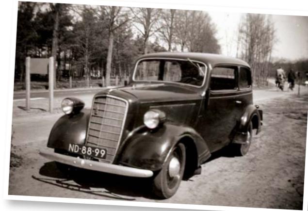
De Opel Super 6

voorzienend was met een grote moestuin en enkele koeien en kippen, zodat de gasten echt verse producten voorgeschoteld kregen. De menukaart had een Hoefslagje kunnen zijn. Klassieke Franse gerechten waren hun specialiteit. Grenzend aan het Wallaardt Sacré Kamp,