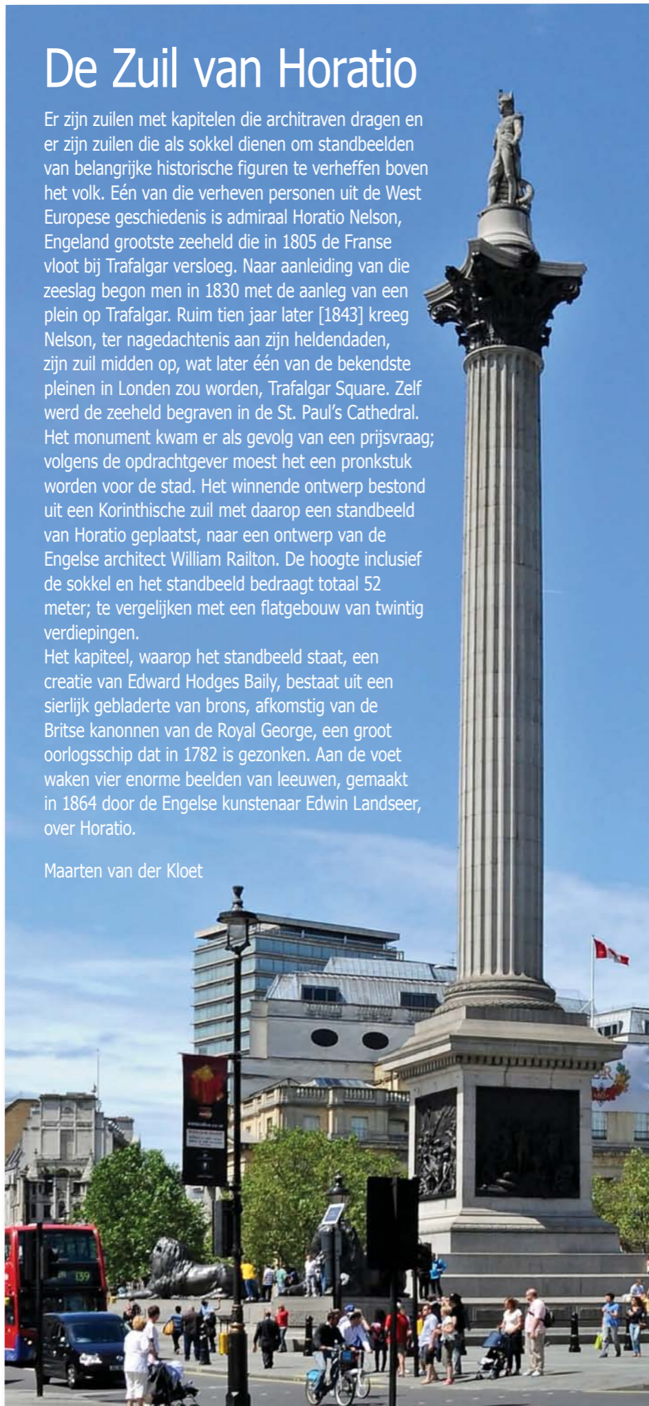
Nelson's column, London, Trafalgar Square (1843)