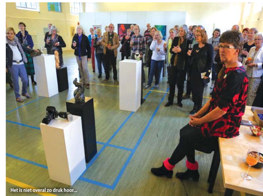
Het is niet overal zo druk hoor...

Meer informatie over de route en de deelnemende kunstenaars vindt u op www.kunstrondendolder.nl . De routebeschrijving