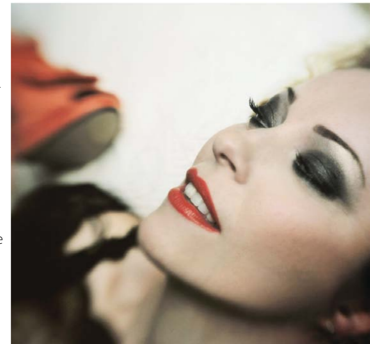
Anneke van Giersbergen