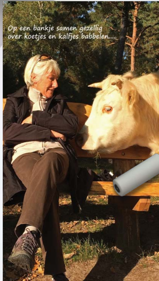
Op een bankje samen gezellig over koetjes en kalfjes babbelen.....