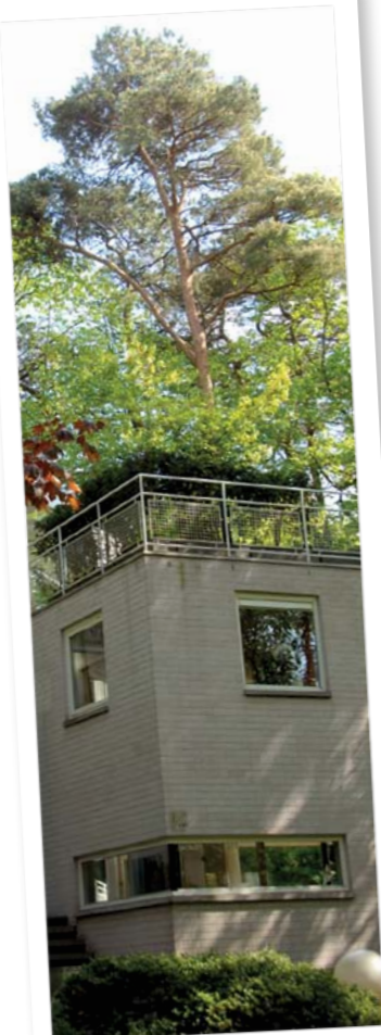
'Het gezicht van Bosch en Duin' Populierenlaan 13A Ingezonden door: Maarten van der Kloet

Aanplakregels: Tekst maximaal 150 woorden, de redactie behoudt het recht inzendingen zonnodig in te korten. Afbeeldingen in zo hoog mogelijke resolutie, een te lage resolutie kan niet worden afgedrukt. Publicatie op volgorde van binnenkomst. Inzendingen die met Bosch en Duin e.o. te maken hebben krijgen voorrang. Bij teveel inzendingen kan publicatie naar een volgende uitgave worden doorgeschoven. Inzendingen dienen aan de gangbare fatsoensnormen te voldoen en geen feitelijke onjuistheden bevatten. De redactie behoudt het recht inzendingen te weigeren voor publicatie. Vermeld duidelijk uw naam onder welke uw inzending gepubliceerd wordt. Inzendingen vertegenwoordigen niet de mening of