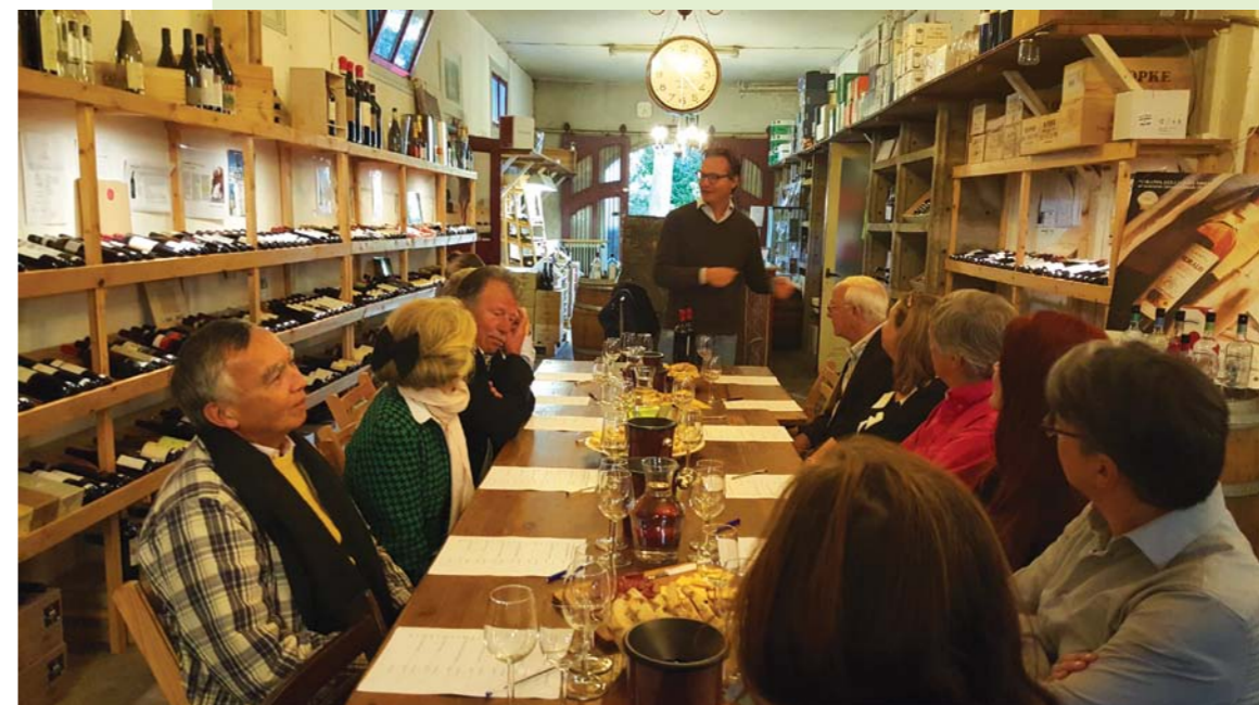
Wijn proeven bij onze plaatselijke specialist.

gemeente Zeist deze opvang binnen 24 uur van de grond tilde. Wat in andere gemeenten niet lukte, kreeg Zeist wel voor elkaar." Momenteel werkt de gemeente Zeist, in samenspraak met de gemeente Soest, aan langduriger opvangmogelijkheden in Kamp van Zeist bij Soesterberg. Uw bestuur volgt deze ontwikkelingen nauwlettend voor u.