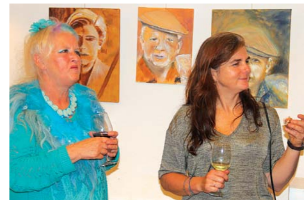
Zonder deze dames geen Salon.