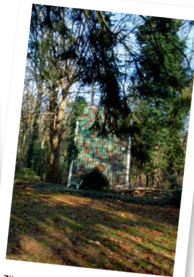
Zijgevel van het oudste trafohuisje (1926/27) in Bosch en Duin tegenover de Baarnseweg 2A/2A1.

De bijeenkomsten zijn in de bibliotheek in Zeist, elke twee weken op woensdag van 10.00u tot 12.00. In juli en augustus is een zomerstop. Voor de bijeenkomsten stelt de bibliotheek een ruimte met flap-over, laptop en beamer beschikbaar. Ook koffie en thee worden door de bibliotheek verzorgd. Voor deze faciliteiten brengt de bibliotheek € 72,50 per jaar voor leden en € 87,50 voor niet leden in rekening. Voor inlichtingen kunt U zich wenden tot Wietze van Houten, 030-6995354 of per mail: w.v.houten@kpnmail.nl