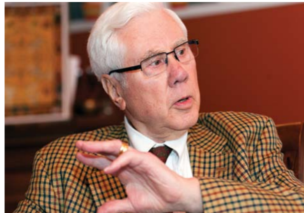
Ontsluiting betekende toen iets heel anders...