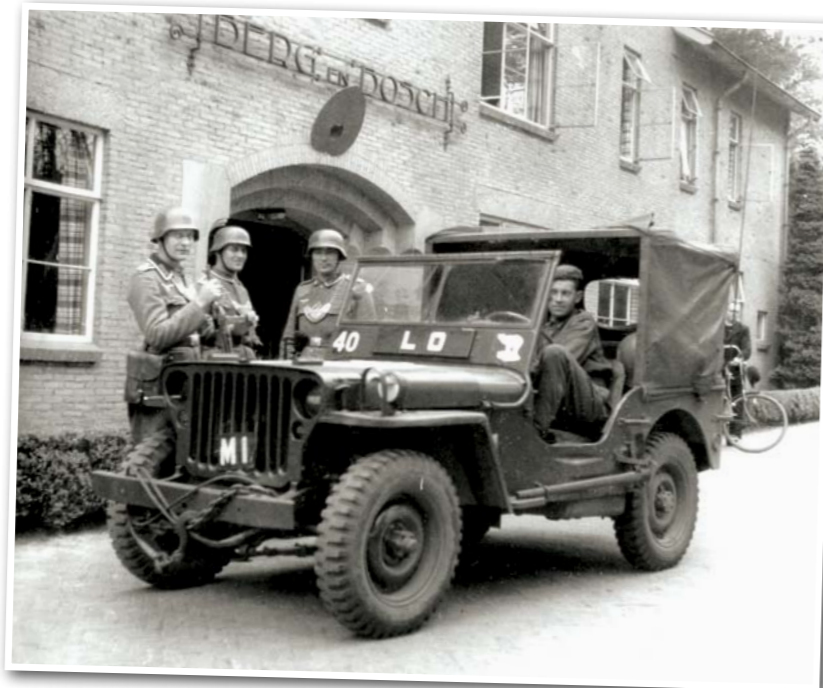
Tegenwoordig herbergt Berg en Bosch medische instellingen in plaats van soldaten.