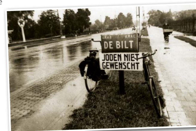
Nu, 70 jaar na dato, zijn deze taferelen moeilijk voor te stellen in onze regio.