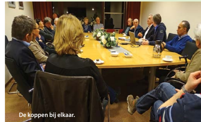
De koppen bij elkaar.