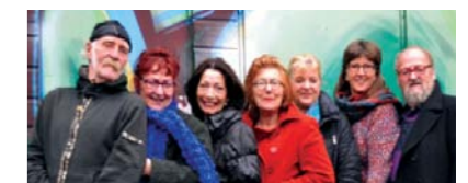
Het bestuur van Stichting Kunst Rond Den Dolder

Meer informatie en aanmelden kan via de website www.kunstrondendolder.nl Wij gaan er met z'n allen een kunst-en- kleurrijk weekend van maken.