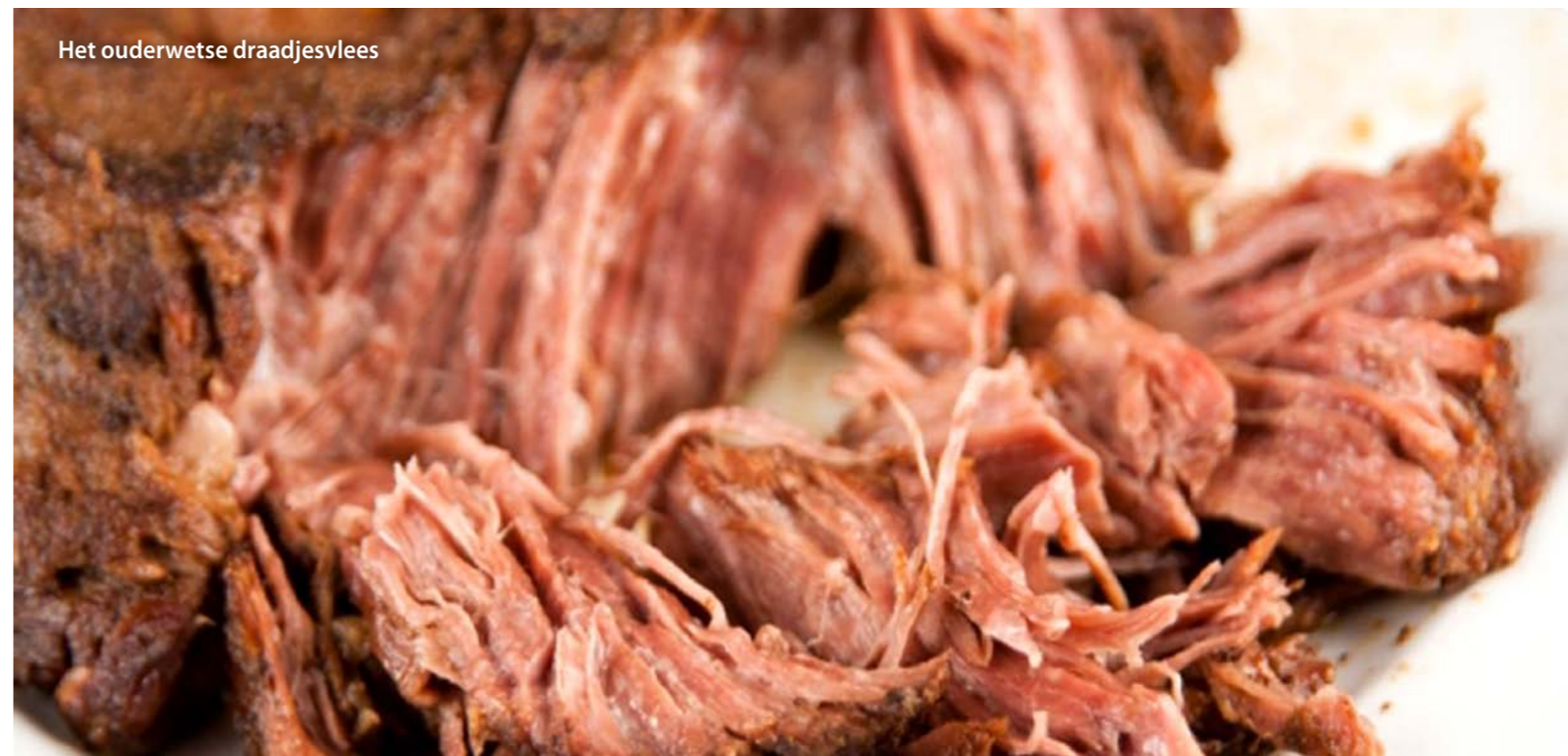
Het ouderwetse draadjesvlees

Kijk na een half uurtje eens of het vlees zachtjes pruttelt en of er nog genoeg vocht aanwezig is. Zet zonodig de oven iets hoger of voeg wat wijn toe. Kijk ook na een uur even. Na 2 tot 2 ½ uur zal het vlees, afhankelijk van de kwaliteit, gaar zijn. Prik er ter controle met een vork in, het vlees moet gemakkelijk uit elkaar gaan.