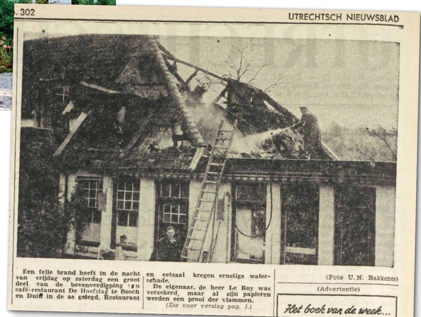
Utrechts Nieuwsblad 25 april 1959.