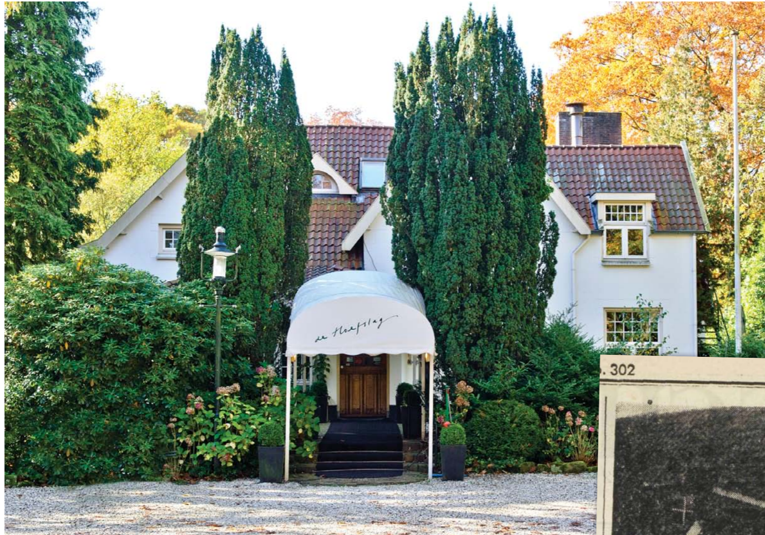
De huidige Hoefslag, hoe anders dan in 1959.