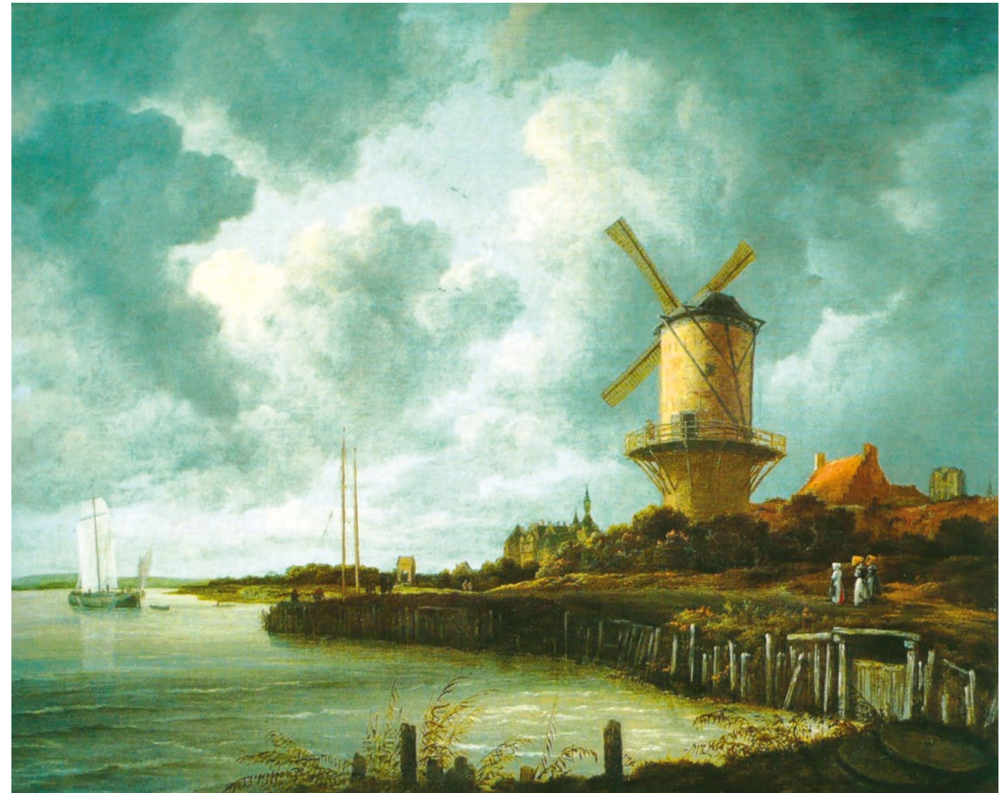
Jacob Isaacksz. van Ruisdael (1629-1682), De Molen van Wijk bij Duurstede

De zeventiende-eeuwse genrekunstenaar schilderde taferelen die de schijn kunnen wekken uit het dagelijks leven te zijn gegrepen. Maar ze zijn nooit spontaan naar het ogenblik vastgelegd zoals in onze huidige tijd een foto wordt gemaakt. Elk schilderijtje werd in werkelijkheid in het atelier gecomponeerd. Daar komt bij dat de schilders vrijwel altijd, hoe levensecht de schilderijen ook zijn, een gedachte wilden meedelen, een vermaning